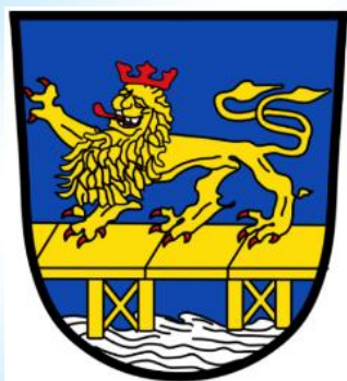
Markt Bruck i.d.OPf.